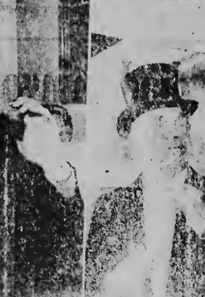
DULLES NO.OFICIAL. — E tres fotonan aki ta mustra John Foster Dulles, kende a muri diadomingo den su sonjo, na hospital, no-oficial durante su carera diplomatico...